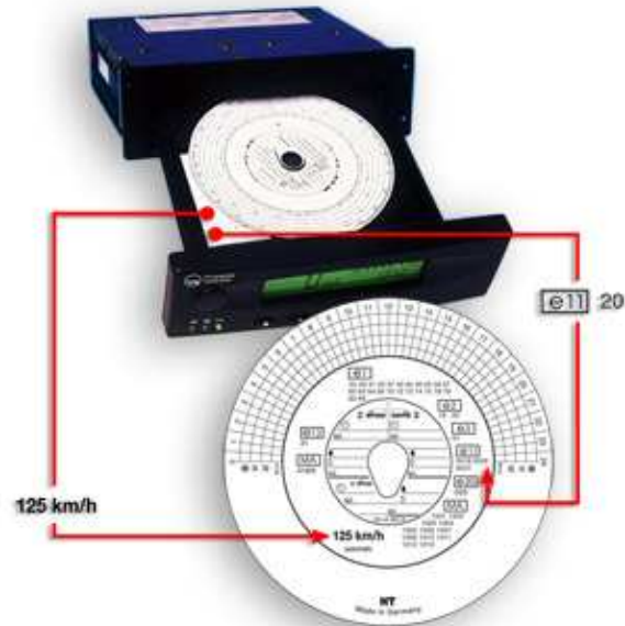
Fig. : Tachygraphe

Après avoir vérifié l'étalonnage des vitesses et du compte tours du disque par rapport à votre appareil, 1 seule condition : le numéro d'homologation de votre tachygraphe doit se trouver au dos du disque que vous utilisez.